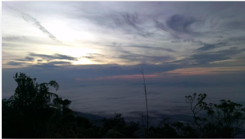
Pemandangan awan di puncak Gunung Ledang