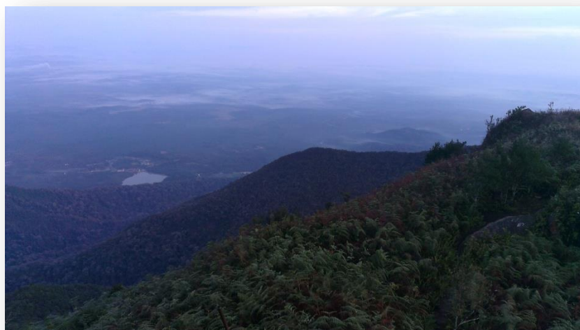
Pemandangan hutan dari puncak Gunung Ledang