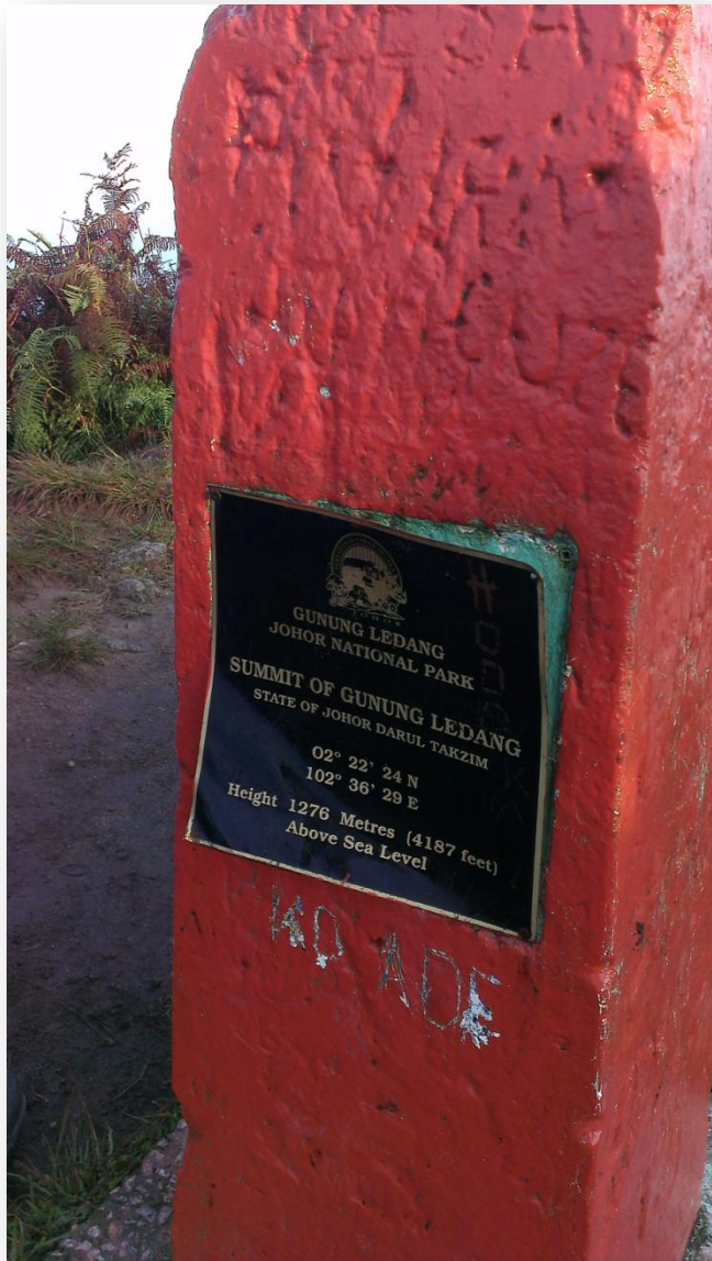
Batu penanda aras tinggi di puncak Gunung Ledang