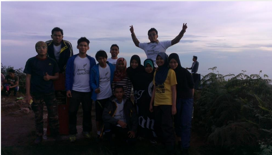
Wajah penat bercampur gembira peserta