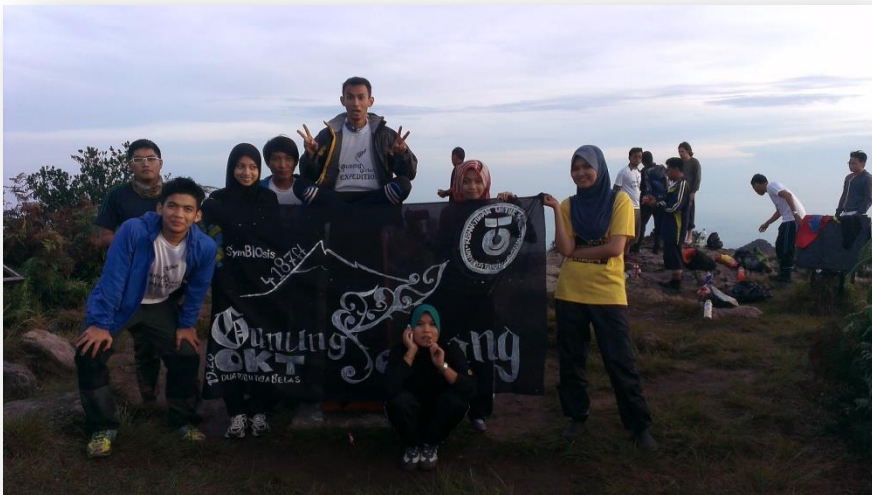
Para peserta bergambar bersama bunting yang dilukis