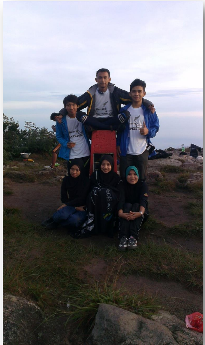
Peserta bergambar di batu penanda aras tinggi