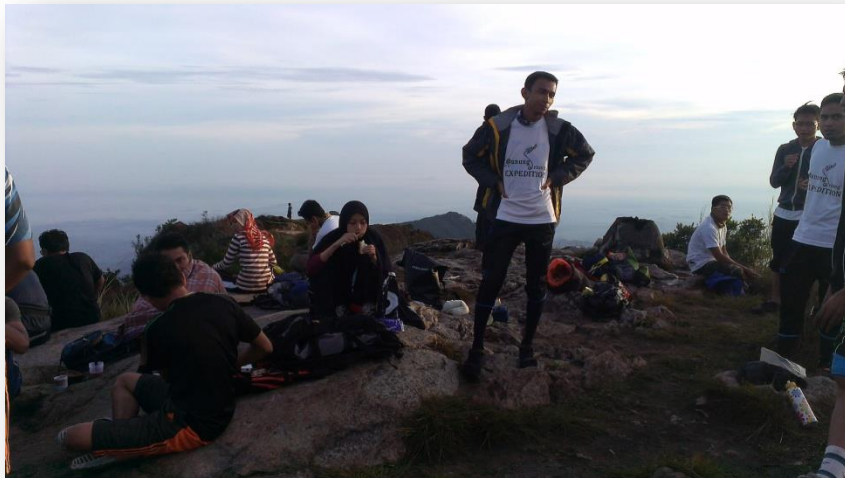
Para peserta beresah selepas penat mendaki